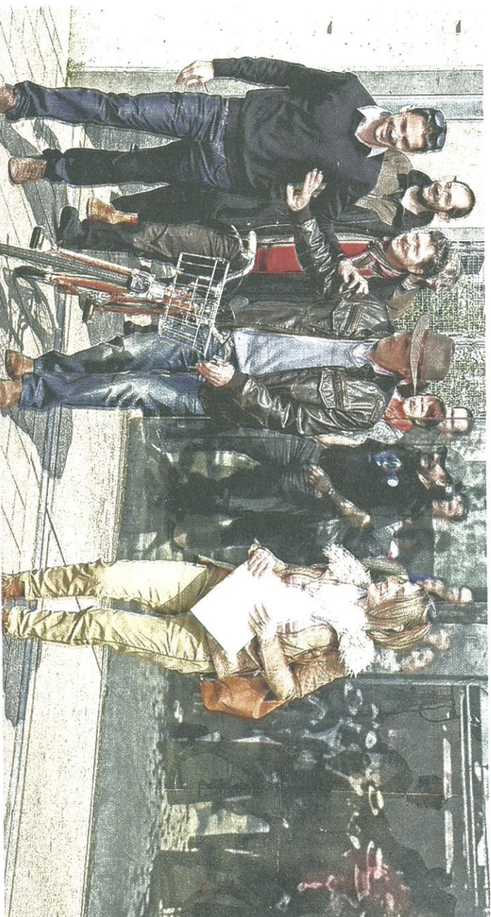
■ Cinéphiles, curieux, entreprises et groupes, ONL, Maison de la danse, Célestins, Barreau de Lyon, Fondation Richard pour les personnes handicapées, résidents de la maison de retraite de La Rotonde, professionnels du cinéma de la région, journalistes du Progrès, ont participé au tournage.

Autre subterfuge historique : le résultat ne lui donnant pas satisfaction, Louis Lumière décide de retourner la séquence un peu plus tard, en mai ou juillet, on ne sait pas trop. Rendez-vous est pris un dimanche, après la messe : voilà pourquoi les ouvrières sont si élégantes et les quelques hommes si endimanchés. Ces 45 secondes feront le tour du monde. 120 ans après le coup de manivelle du printemps, rebolote : l'Institut Lumière immortalise le Jour J en tournant des remakes en numérique. Une réponse aux versions signées Quentin